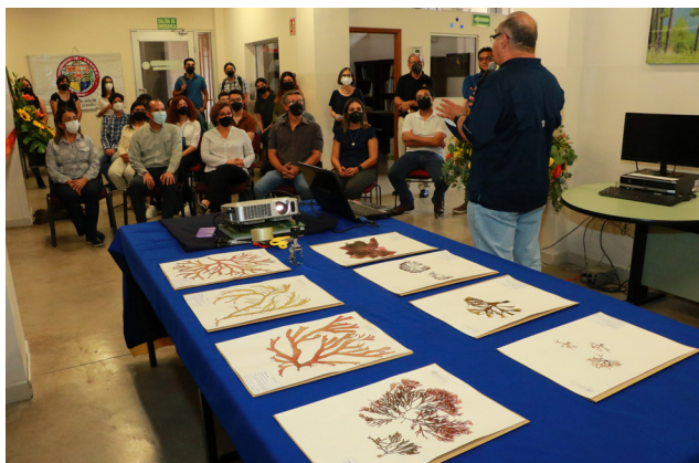
Figura 2. Evento de inauguración de la Ficoteca del Herbario USON el 5 de octubre de 2022.

intercambio con otras colecciones ficológicas del país. Además, los registros y ejemplares depositados en esta nueva colección científica servirán de apoyo de proyectos de investigación correspondientes a las áreas prioritarias de generación del conocimiento del DICTUS: Ecología y Manejo de Recursos Naturales y Biociencias Moleculares y Biotecnología.